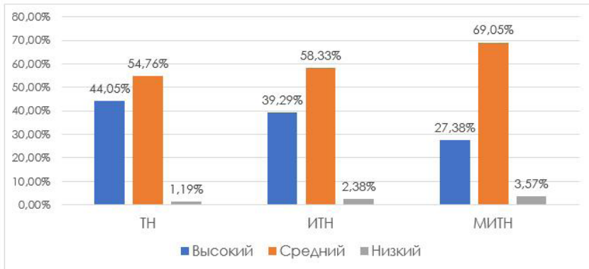
Рисунок 3. Процентное соотношение уровня выраженности толерантности к неопределенности по каждой шкале, % (n = 84).

Далее представлено распределение показателей толерантности, интолерантности и межличностной интолерантности к неопределенности, полученных с помощью опросника Т. В. Корниловой. Как видно из рисунка 3, все три шкалы имеют средний уровень выраженности у большинства респондентов.