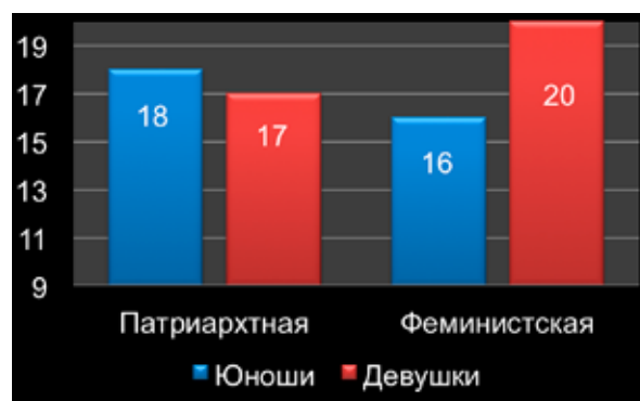
Рис. 2. Выраженность полюсов гендерной идеологии у респондентов выборки (в баллах)

и девушек на гендерное равенство. Юноши в значительной меньшей степени ориентированы на восприятие девушек в качестве равноправных партнеров по социальному взаимодействию (Kolmogorov-Smirnov Z = 2,875 при Asymp. Sig = 0,000). При этом у юношей значимо более выражено принятие идей социального доминирования (Kolmogorov-Smirnov Z = 1,890 при Asymp. Sig = 0,002). Такое сочетание обнаружило специфическое проявление в сексуальных аттитюдах. У юношей выявлена корреляция между патриархатными взглядами и оправданием целесообразности сексуального насилия над женщинами ( r = 0,219 при p = 0,01 ), а также – умеренная корреляция между принятием установок на социальное доминирование и проявлением насилия в отношении женщин для склонения их к сексу ( r = 0,199 при p = 0,05 ). Обнаружена связь между взглядами на секс как средство получения удовольствия и стремлением к эксплуатации других в своих интересах ( r = 0,186 при p = 0,05 ), а также с анонимным одноразовым сексом ( r = 0,190 при p = 0,05 ). Совокупность обнаруженных связей может повышать уязвимость женщин в гетеросексуальных отношениях. У юношей также была выявлена сильная корреляция между феминистскими взглядами и резко выраженным отрицанием идей сексуального насилия над женщинами ( r = 0,227 при p = 0,01 ). Таким образом, можно увидеть практическую целесообразность пропаганды феминистских взглядов среди юношей как фактора, управляющего гендерным поведением мужчин и снижающим уязвимость женщин.