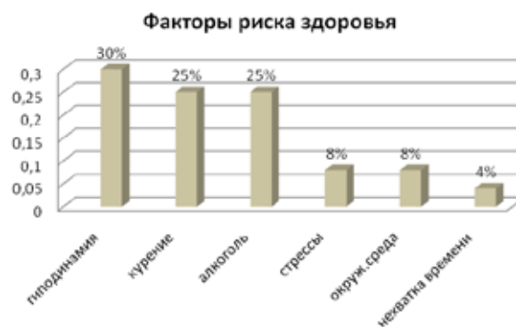
Рис. 3. Выявление факторов риска здоровья

Говоря о факторах риска, мы выявили, что большинство студентов выдают социально желаемые ответы, повторяя мнение, принятое в обществе (рисунок 3.)