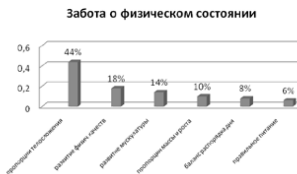
Рис. 4. В чем проявляется забота о Вашем физическом состоянии?

Следующий вопрос анкеты демонстрирует смысловое понимание студентами принципов и направлений заботы о своем физическом состоянии (рисунок 4).