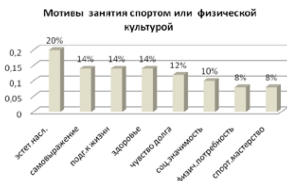
Рис. 2. Мотивы занятия студентами физической культурой и спортом

Относительно мотивации занятиями физической культурой и спортом, мы выявили, что большинство студентов (20 %) испытывают эстетические потребности (развитие собственной красоты, физической силы, выносливости) (рисунок 2).